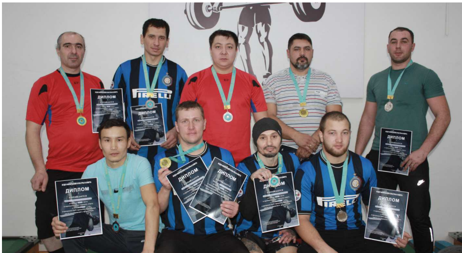
График проведения соревнований XXIX комплексной городской спартакиады г. Степногорска

Поздравляем наших коллег с успешным стартом в XXIX городской спартакиаде!